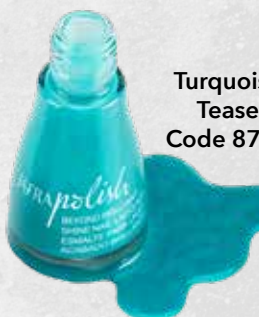
Turquoise Tease Code 8755