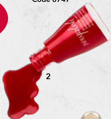
Date Night Red Code 8747