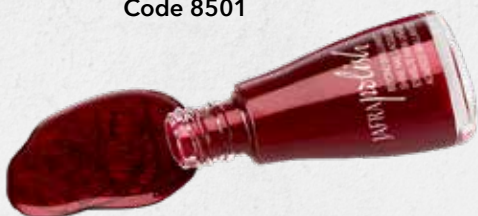
Magenta Muse Code 8501