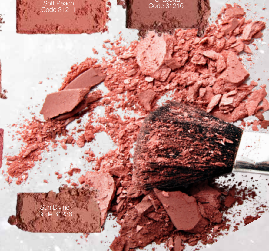
Sun Divine Code 31236