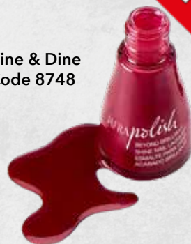
Wine & Dine Code 8748