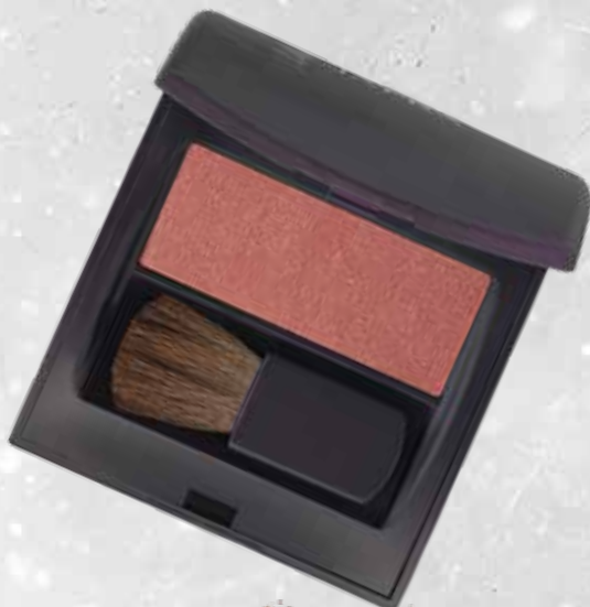
Rose Oro Code 31191

Fard en poudre luxueux et soyeux qui s'estompe facilement, pour une couvrance idéale et un fini naturel. Formulé avec des vitamines C et E antioxydantes.