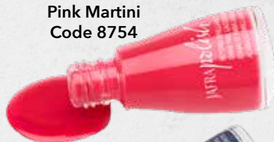
Pink Martini Code 8754