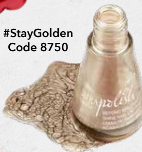
#StayGolden Code 8750